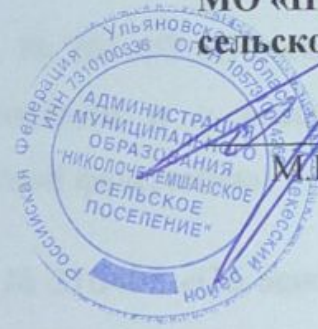
СХЕМА ТЕПЛОСНАБЖЕНИЯ МО «НИКОЛОЧЕРЕМШАНСКОЕ СЕЛЬСКОЕ ПОСЕЛЕНИЕ» МЕЛЕКЕССКОГО РАЙОНА УЛЬЯНОВСКОЙ ОБЛАСТИ