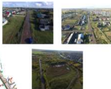
Фото объекта до начала реконструкции