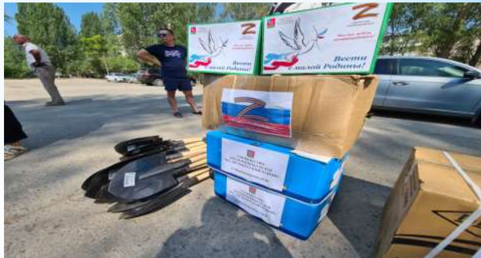
«Своих не бросаем»