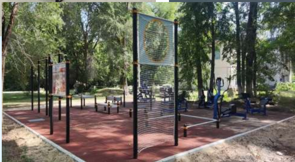
Площадка ГТО с. Рязаново