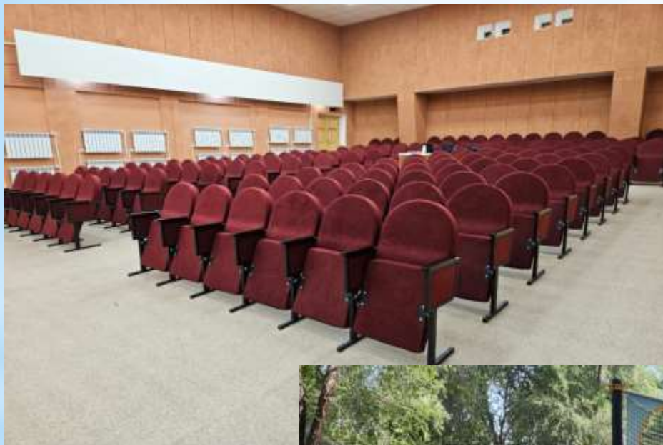
Дом культуры с. Тиинск