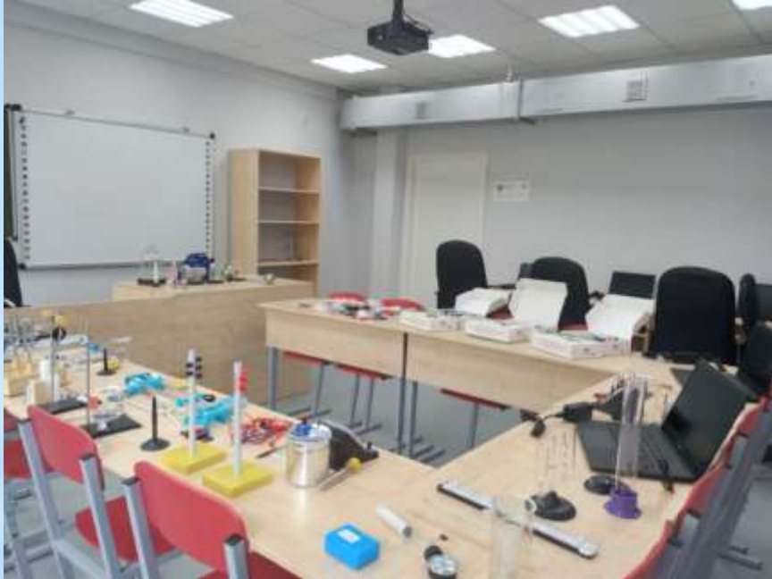
«Точка роста» с. Слобода -Выходцево