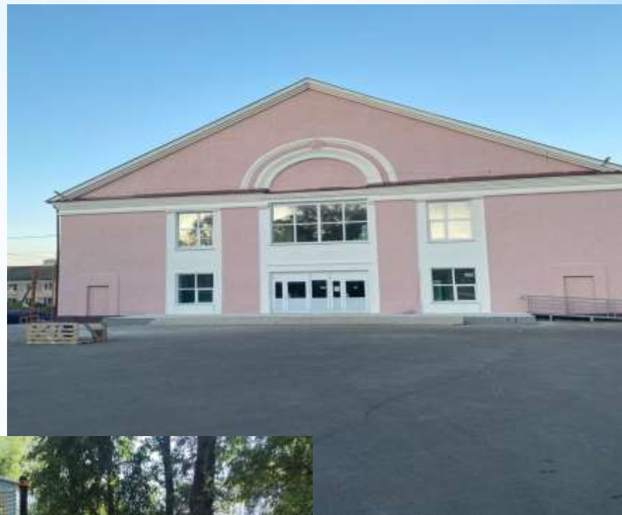
Дом культуры п. Новоселки