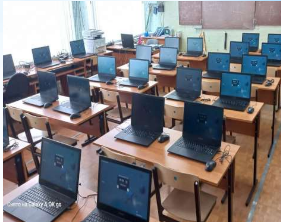
«Модель цифровой образовательной среды