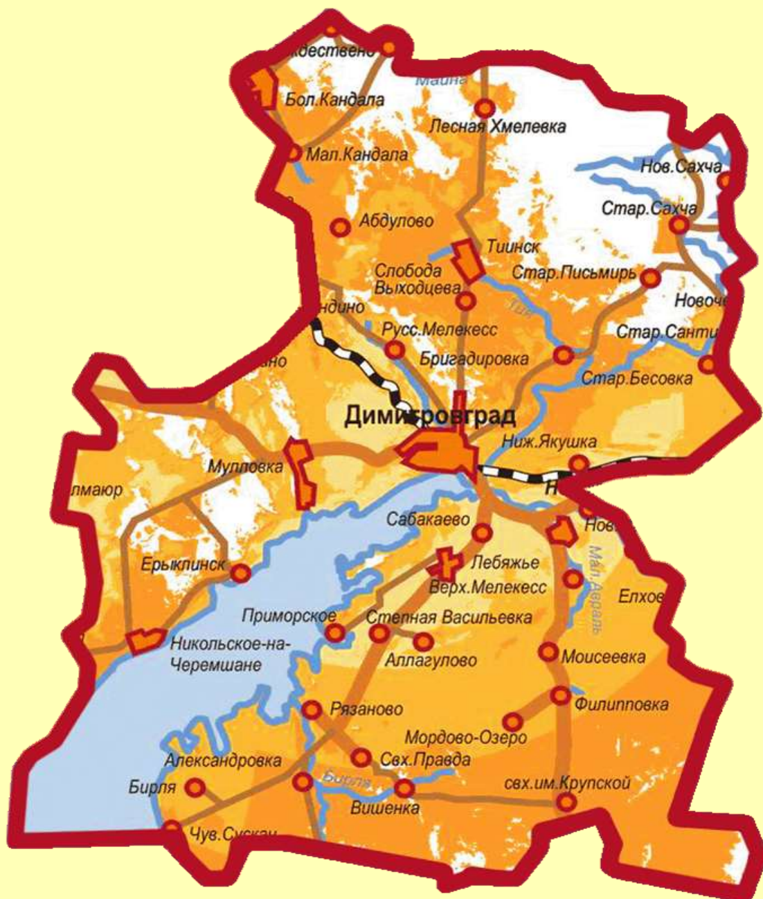
муниципальное образование «Мелекесский район» Ульяновской области