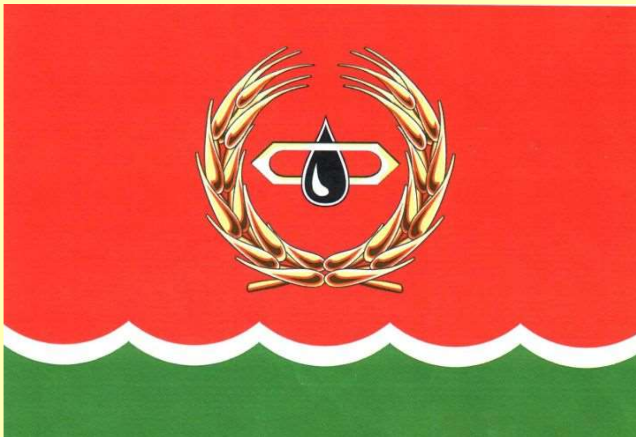
Герб и флаг муниципального образования «Мелекесский район» Ульяновской области