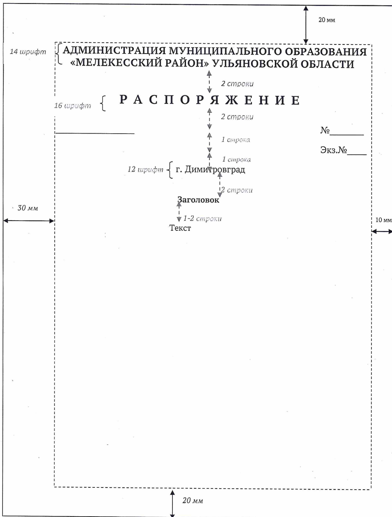
Образец бланка постановления администрации муниципального образования «Мелекесский район» Ульяновской области